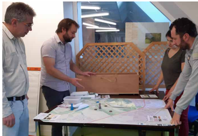
Temps d'échange collectif organisé en décembre 2019

Par la suite, nous avons proposé un temps d'échange collectif à ces acteurs pour partager et vérifier l'état des lieux établi et réfléchir ensemble à une stratégie à adopter sur la trame bleue, qui pourrait être discutée au niveau régional. Soit dans le cadre de la boîte à outils CHEMINS ou plus largement au niveau de l'Agence Bretonne de la Biodiversité par exemple. Cette rencontre était une première étape de réflexion collective sur cette démarche « trame bleue ». Elle reste à poursuivre avec l'ensemble des acteurs contactés dans un premier temps et doit intégrer d'autres acteurs identifiés depuis.